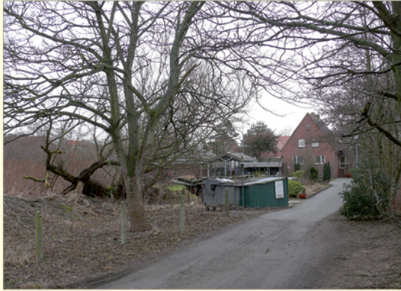
Grundlage der Planungen der Borkum-Stiftung ist dieses Gelände

lien. Dies führt letztendlich zur Abwanderung und Verdrängung der einheimischen Bevölkerung, vor allem den jüngeren Mitbürgern. Dagegen möchte die Borkum-Stiftung etwas tun und hat Anfang 2013 dieses Thema aufgegriffen.